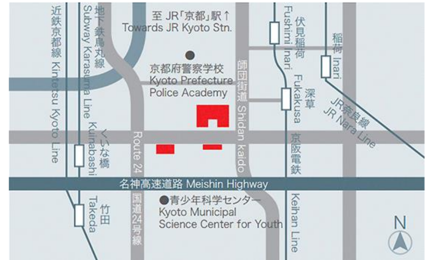
深草キャンパスマップ